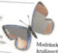
Modrásek krušinový (samec)

cu, která je v bičíkem. NI který lin vištěm putu- u. z, který se pělému