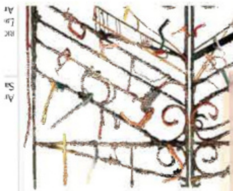
-1940 1937 cthon