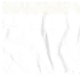
QC.2021.ACERVO.0006 PRJ A