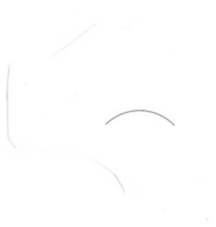
QC.2021.ACERVO.0006 PRJ 001