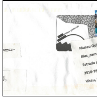
QC.2021.ACERVO.0006 PRJ A